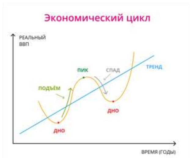
Рис.1. Экономический цикл

Краткосрочные колебания экономического цикла (подъём, спад) не являются экономическим ростом. Экономический рост (тренд) проявляется в долговременном увеличении ВВП.